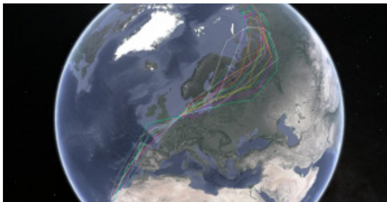
Trekroutes van individuele rosse grutto's die West-Afrika via de Waddenzee met de Siberische toendra's verbinden.

Daarnaast worden enkele zaken opgesomd die duidelijk de aandacht vragen in de komende periode. Gesignaleerd wordt de achteruitgang van vis en