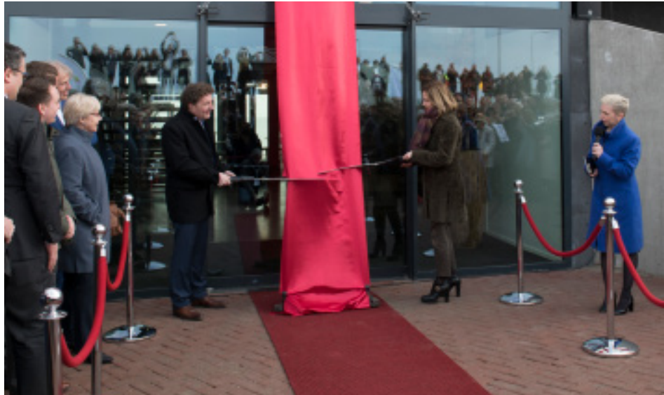
Opening Afsluitdijk Wadden Center door minister Van Nieuwenhuizen (rechts) en gedeputeerde Kielstra (links) op 22 maart 2018

Hoe verhoudt zich het Verdrag ten opzichte van gemeentelijke en bovenregionale afspraken? Is dat een kwestie van geleidelijk aftasten en invullen?