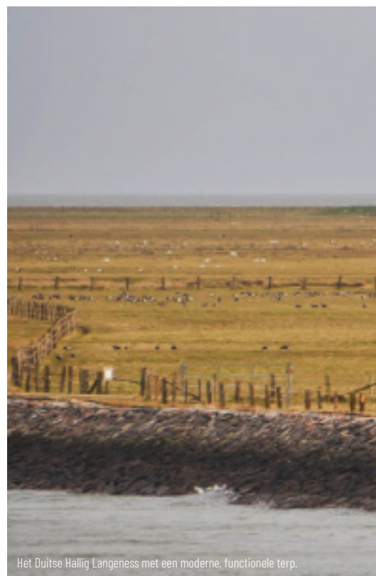
Het Duitse Hallig Langeness met een moderne, functionele terp.

Levert die trilaterale samenwerking dan wel wat op? Zeker. De basis voor effectief optreden door een aantal landen samen ligt in overeenstemming over basale uitgangspunten. En in de trilaterale samenwerking is dat het meest pregnant verwoord in het 'Guiding Principle' dat er op neer komt dat in de Waddenzee natuurlijke processen zich ongestoord moeten kunnen voltrekken (voor zover mogelijk, dat dan weer wel...). Dat heeft geleid tot gestructureerd nadenken over beheer, tot het vergelijkbaar maken van onderzoeksgegevens, tot monitoring en afspraken over 'menselijk medegebruik'. IJkpunten dus.