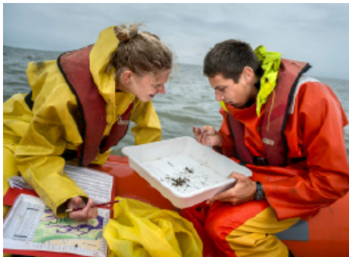
Onderzoek NIOZ Waddenzee