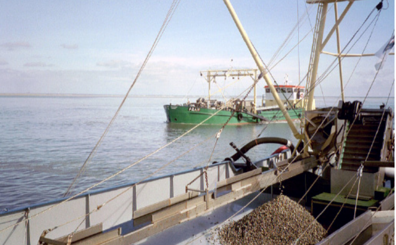
Kokkelvisserij is het vissen naar kokkels, een schelpdier dat onder andere in de Waddenzee leeft. Ze worden ook wel kokkelaars genoemd.

demie en het Waddenfonds tot stand. Belangrijke gezamenlijke doorbraken werden bereikt onder verantwoordelijkheid van de minister van Landbouw, Visserij en Natuurbehoud (LNV). Daarbij ging het o.a. om het beëindigen van de mechanische kokkelvisserij en het Convenant Transitie Mosselsector. Dit convenant is gericht op natuurherstel en innovatie in de mosselsector met beëindiging van de nadelige bodembeoerende vorm van mosselzaadvisserij. Ook kwam in samenhang hiermee het 'Programma naar een Rijke Waddenzee (PRW), waarin natuurorganisaties, gebruikers, wetenschap en overheid intensief gingen samenwerken, tot stand. De Nieuwsbrief van het PRW constateert in 2016 dat genoemd convenant zijn vruchten begint af te werpen voor mens en natuur.