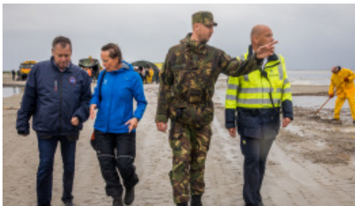
Samenwerking beheerders bij oliebestrijdingsoefening

menlijke doel. Van daaruit gaan we als beheerders door op de ingeslagen weg.